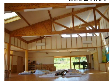
遊戯室~5歳児保育室