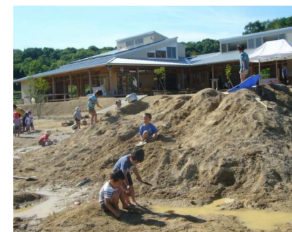
園庭砂山で砂遊び