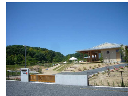
エントランス（東側外観）