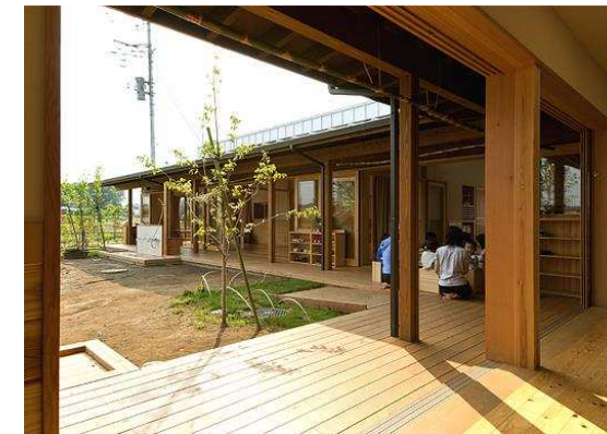
遊戯室から0歳児保育室側を見る